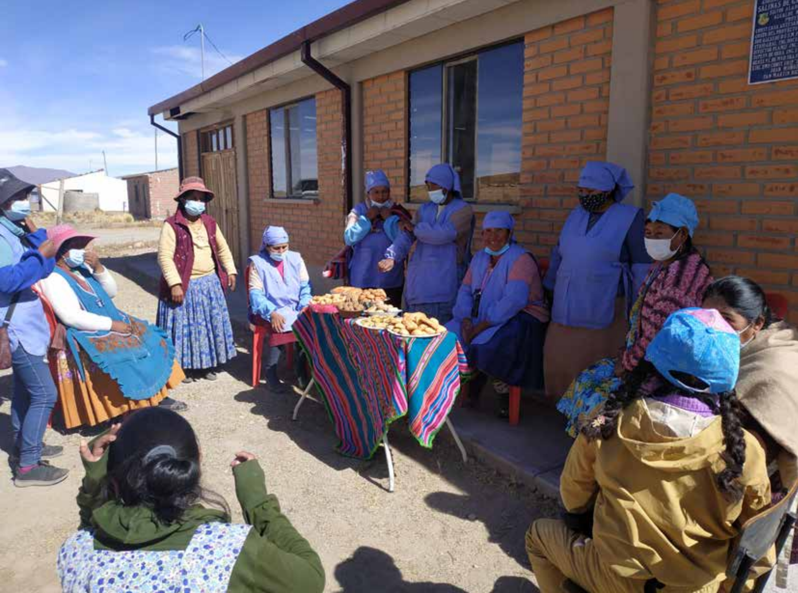
Mujeres emprendedoras de Salinas, Oruro, Bolivia. ■ APROSAR

el etiquetado de productos alimenticios con el fin de informar a las/os consumidoras/es sobre el valor nutricional de los alimentos. Esto de acuerdo con lo dispuesto en la Ley N° 30021 de 2013 de Promoción de la Alimentación Saludable. El aplicativo usa octógonos de colores de advertencia nutricional para reconocer los alimentos y las bebidas que tienen un alto contenido de azúcar, sodio/sal, grasas, grasas saturadas y grasas trans. Por último, se apoyó la campaña para la aprobación de la Ley de Ampliación de la Moratoria del Ingreso de Organismos Genéticamente Modificados (OGM) durante 15 años más (hasta el 31 de diciembre de 2035).