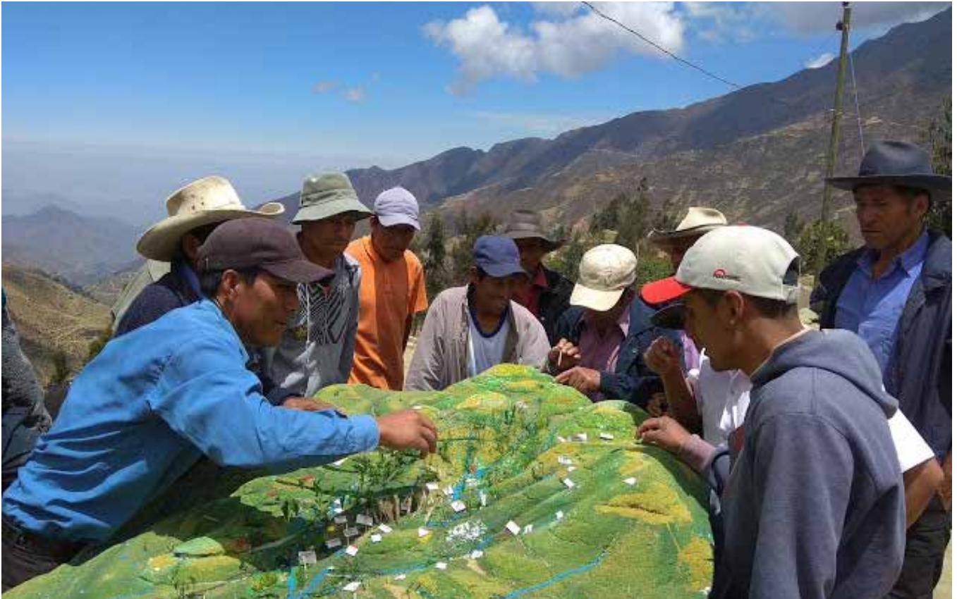
Comuneros de Pamparomás, Perú, ultimando detalles en la maqueta 3D de su microcuenca y debatiendo escenarios de gestión territorial comunal. ■ JDDP

Estas experiencias de planificación y gestión territorial comunitaria consistieron en procesos ascendentes “de abajo hacia arriba” (desde lo micro a lo macro), impulsadas para conservar los recursos naturales y para potenciar la actividad principal de las familias campesinas: la agricultura familiar y los procesos de transición agroecológica. Ello, desde una perspectiva de derechos territoriales, ambientales y socioculturales, así como de participación política. La mayoría de las familias encuestadas al final del programa (70% en Bolivia y 95% en Perú) ha expresado mejora en el ejercicio de sus derechos ambientales y en la gestión del territorio. En este sentido, la evaluación final del programa ITV señala que