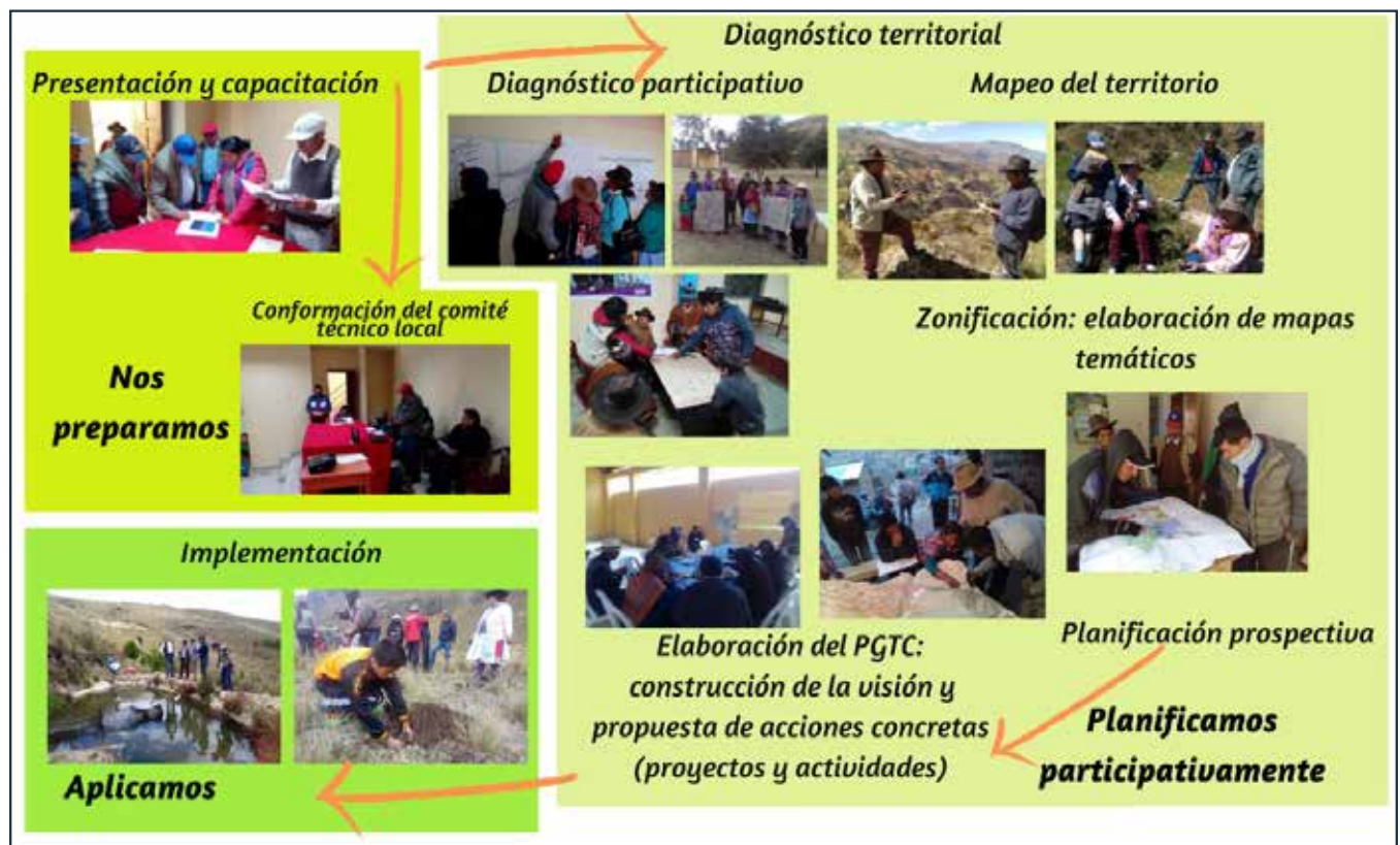
Figura 2. Ruta metodológica del proceso de gestión territorial comunal aplicado en Aija, Perú

Me capacité en cursos de biohuertos y reforestación. Fui autoridad comunal y con apoyo del [programa] [...] la capacitación en gestión territorial me interesó [y] más los mapas georreferenciados de la comunidad (comunero de Vila Vila, Salinas, Bolivia).