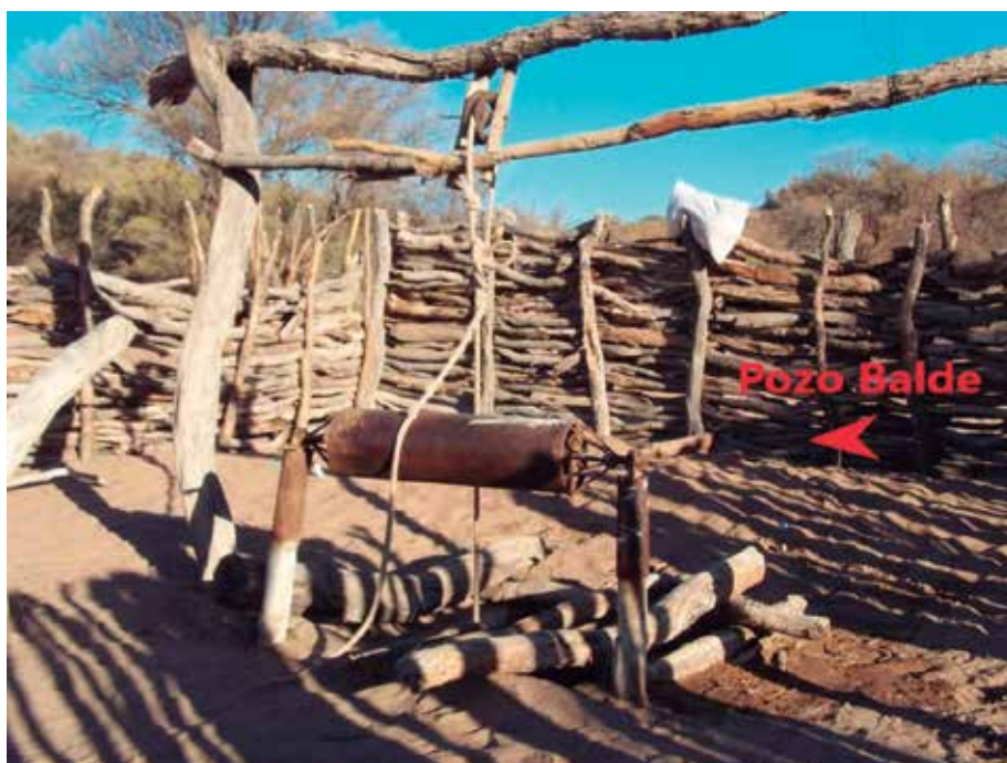
Pozo-balde sin mejoras tecnológicas en una de las unidades productivas (foto 1). A. Tonolli y A. Fruitsos

En las unidades domésticas seleccionadas los bebederos estaban contruidos con cubiertas de automóviles cortadas en mitades. Estos dispositivos tienen poca capacidad de almacenamiento y, cuando hay amontonamiento de animales, resultan inestables y vuelcan fácilmente su contenido. En particular una de las unidades domésticas no contaba con receptáculo de agua, de manera que el abastecimiento