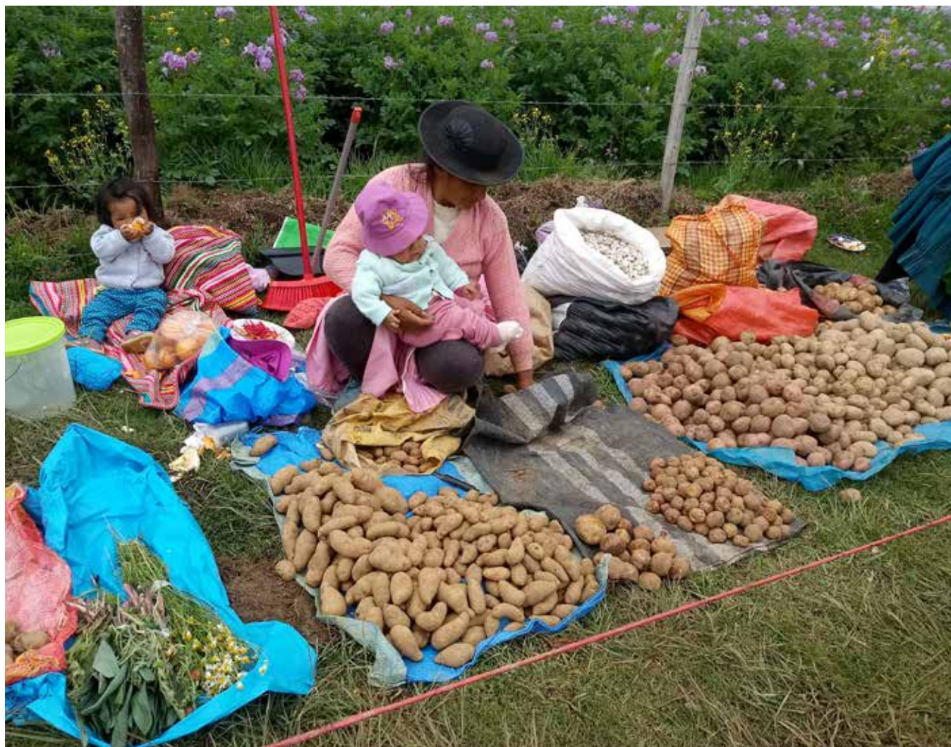
▣ Grupo Yanapai.

Contar con un mayor número de variedades es importante para los/as guardianes/as, ya que reafirma